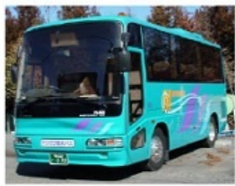
4列20人乗りサロン車

一度行ってみたいかった話題の観光地 ご希望に応じたコースの企画・見積と 手配・ご案内をさせていただきます