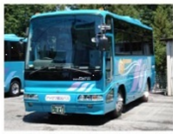
4列21人乗りサロン車