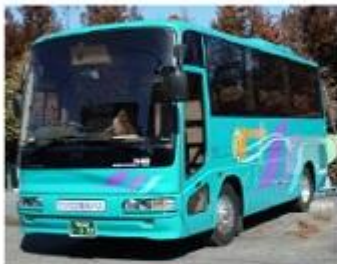
4列20人乗りサロン車