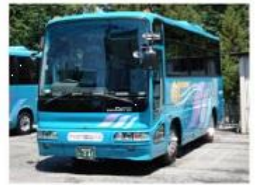
4列21人乗りサロン車